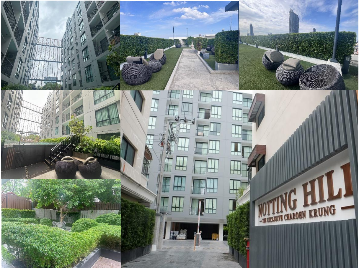
รูปที่ 1-2 สภาพปัจจุบันของโครงการ

ปัจจุบันโครงการได้เปิดดำเนินการแล้ว มีผู้ที่พักอาศัยในอาคารที่อยู่ประมาณร้อยละ 75.75 ของห้องชุดทั้งหมด (ห้องชุดทั้งหมด 132 ห้อง เข้าอยู่แล้ว 100 ห้อง)